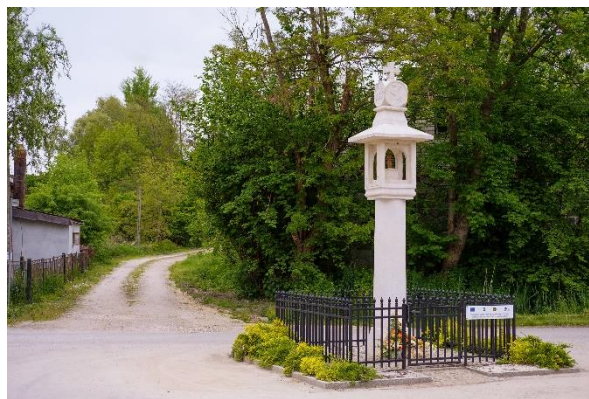
Kapliczka Jana Ewangelisty w Chruszczynie Wielkiej