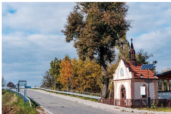
Kapliczka Św. Jana Nepomucena

Bardzo ważne dla działalności Nadwiślańskiej Grupy Działania „E.O.CENOMA” było zadbanie o dorobek historyczny, sakralny oraz kulturowych. LGD zorganizowało 2 nabory w w/w zakresie. Z dofinansowania skorzystały 4 wnioski, które w ramach działania przeprowadziły renowacje kapliczek, figur oraz zabytków. Całkowity koszt dofinansowania zamknął się w kwocie 199 998,00 zł.