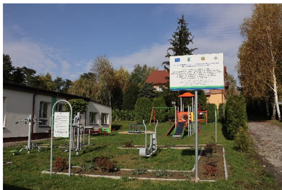
Plac zabaw i zielona siłownia w Kamieńczykach

Stowarzyszenie przeprowadziło 3 nabory w zakresie wzbogacenia oferty czasu wolnego w zakresie rekreacji na kwotę 1 875 967,50 zł. Dofinansowanie otrzymało 19 wniosków. Na terenie 7 Gmin stworzono zielone siłownie, place zabaw, przestrzenie aktywnego wypoczynku oraz ruchu turystycznego, boiska sportowe, miejsca obsługi rowerzystów. W konkursie wzięły udział, Stowarzyszenia, urzędy Gmin, Ochotnicze Straże Pożarne.