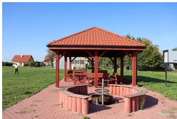
Altana przy Iądowisku w Strzelcach Małych

528 670,48 zł to kwota jaka została przeznaczona na sfinansowanie 9 wniosków promujących lokalną turystykę. Dzięki pozyskanym funduszom powstały altany, tablice informacyjne, oznakowania turystyczne, deptaki oraz mała architektura.