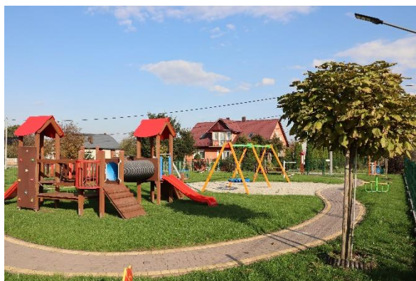
Plac Zabaw w Hebdowie

Przeprowadzono 4 nabory, w których wzięły udział Urzędy Gmin, Ludowe Kluby Sportowe, Stowarzyszenia, oraz Gminne Centra Kultury. 23 wnioski otrzymały dofinansowanie na łączną kwotę 3 088 237,60 zł. W ramach naborów zastały zmodernizowane boiska sportowe, zakupiono wyposażenie sal GCK, świetlic wiejskich oraz stowarzyszeń, stworzono place zabaw oraz małą architekturę.